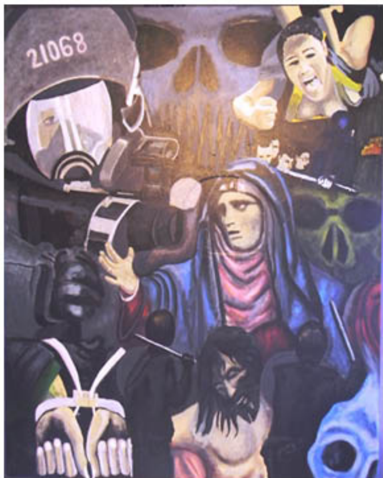
MÉXICANOS DE ROSTRO DESCONOCIDO (México) tumultus ahogados y el precio de nuestra educación, 2012 Acrylic on canvas, 60" x 48"